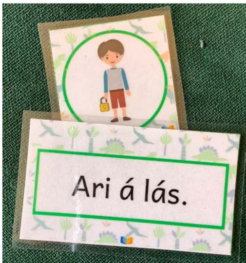
Mynd 5 - Þjálfunartími 1. bekkur, börnin para saman setningu og mynd.

Til þess að tryggja að ekkert barn vinni með texta sem það ræður ekki við er eftirfylgnin mikilvæg. Þess vegna er haldið áfram að leggja Bókstafa- og hljóðaprófið fyrir þau börn sem ekki kunna alla bókstafi og öll hljóð þangað til þeirri færni er náð. Þetta endurmat er lagt fyrir um mitt skólaárið þ.e. í janúar og aftur að vori. Markmiðið þetta fyrsta skólaár er að öll börn kunni að lágmarki alla bókstafi og hljóð þeirra.