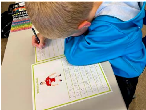
Mynd 7 - Þjálfunartími 2. bekkur, frjáls ritun, börnin teikna mynd og skrifa sögu um hana.

Það er ekki nóg að kunna einungis tæknina við að lesa. Töfrarnir felast í því að skilja það sem lesið er. Barn sem nær að lifa sig inn í heim ritmálsins og næra ímyndunarafli sitt við lestur nýtur þess að lesa. Það dettur inn í ævintýraheim bókanna samhliða því að nýta sér lestur í daglegu lífi. Til þess að það sé hægt þarf málskilningur að vera góður. Barn þarf að búa yfir þeirri færni að skilja tungumál