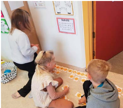
Mynd 4 - Þjálfunartími 1. bekkur, börnin para saman orð og mynd.

Til þess að tryggja að ekkert barn vinni með texta sem það ræður ekki við er eftirfylgnin mikilvæg. Þess vegna er haldið áfram að leggja Bókstafa- og hljóðaprófið fyrir þau börn sem ekki kunna alla bókstafi og öll hljóð þangað til þeirri færni er náð. Þetta endurmat er lagt fyrir um mitt skólaárið þ.e. í janúar og aftur að vori. Markmiðið þetta fyrsta skólaár er að öll börn kunni að lágmarki alla bókstafi og hljóð þeirra.