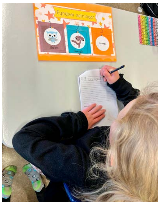
Mynd 12 - Þjálfunartími 2. bekkur, börnin búa til myndnar setningar og skrifa þær niður.

GRÆNT (stig 3): Börnin eru fulllæs. Þegar börnin hafa náð sjálfvirkni í lestrinum geta þau einbeitt sér betur að lesskilningi sem er megin tilgangur lesturs (Walczyk og Griffith-Ross, 2007). Unnið er markvisst með orðaforða og lesskilning á mismunandi erfiðleikastigum.