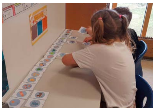
Mynd 2 - 1. bekkur þjálfunartími, börnin para saman einföld orð og mynd.

unnið með tengsl bókstafs og hljóðs. Farið er frá hinu einfalda til hins flókna. Til þess að átta sig á stöðu barna í byrjun skólaárs er Bókstafa- og hljóðaprófið lagt fyrir (Ofteland, 1992). Það mælir hversu marga bókstafi og hljóð barn kann og hvort það getur umskráð eða lesið orð, setningar og texta. Það er gríðarlega mikilvægt að mæla hvar barn stendur svo hægt sé að gefa því réttar áskoranir. Miða þarf við færni allra barna, þeirra sem þekkja fáa bókstafi og þeirra sem þekkja fleiri eða eru farin að lesa. Það að fá réttar áskoranir er lykilatriði til að ná góðum tókum á lesi, of þungar áskoranir geta valdið kvíða og of léttar leiða (Csikszentmihalyi, 2008).