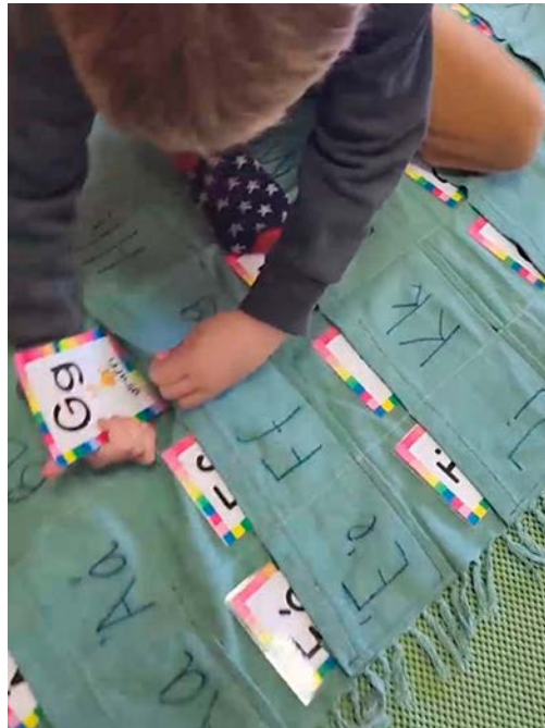
Mynd 3 - 1. bekkur þjálfunartími börnin raða myndum í bókstafavasa.