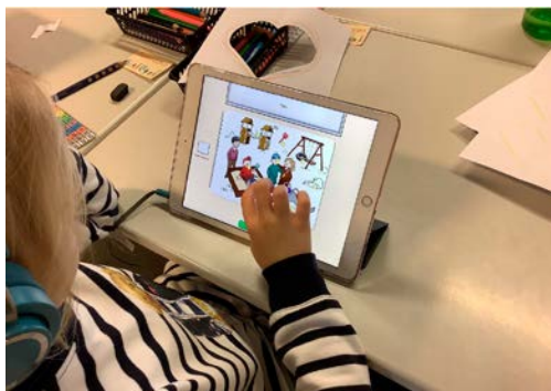
Mynd 6 - Þjálfunartími 1. bekkur - hlustun börnin leysa verkefni í Orðagulli.