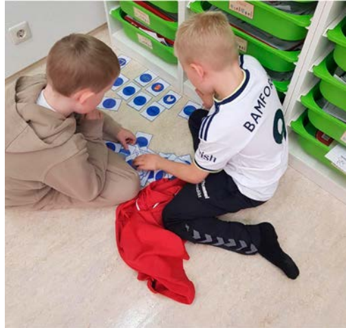
Mynd 11 - Þjálfunartími 2. bekkur, börnin para saman lengri orð og mynd.

GULT (stig 2): Áhersla er á þjálfun og sjálfvirkni í lestrinum. Athygli barnanna er