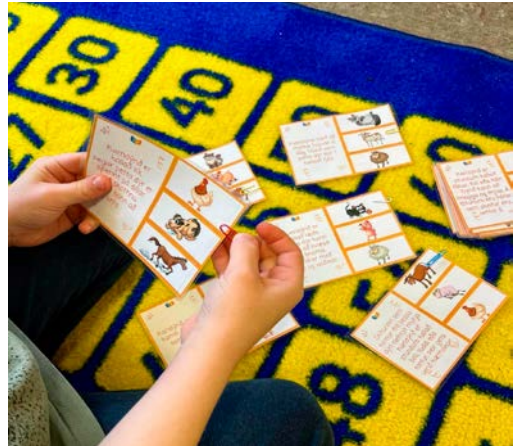
Mynd 8 - Þjálfunartími 2. bekkur, klemmu verkefni í lesskilningi.