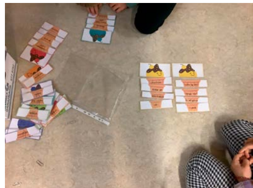
Mynd 9. - Þjálfunartími 2. bekkur, börnin raða orðum upp í setningar.