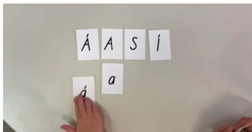
Mynd 1. 1. bekkur þjálfunartími, börnin æfa tengsl bókstafs og hljóðs.

að Kveikjum neistann er heildarnálgun á skólagöngu nemenda og því eru allir lyklar verkefnisins jafn mikilvægir.